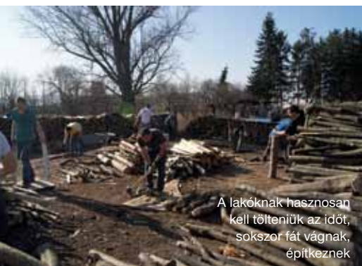
A lakóknak hasznosan kell tölteniük az időt, sokszor fát vágnak, építkeznek